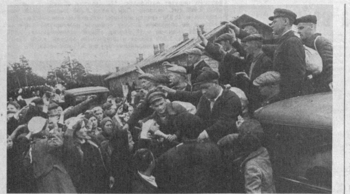
Москва. Проводы в народное ополчение.