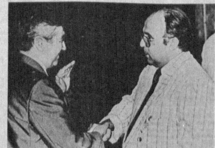
НА СНИМКЕ: деловые контакты.