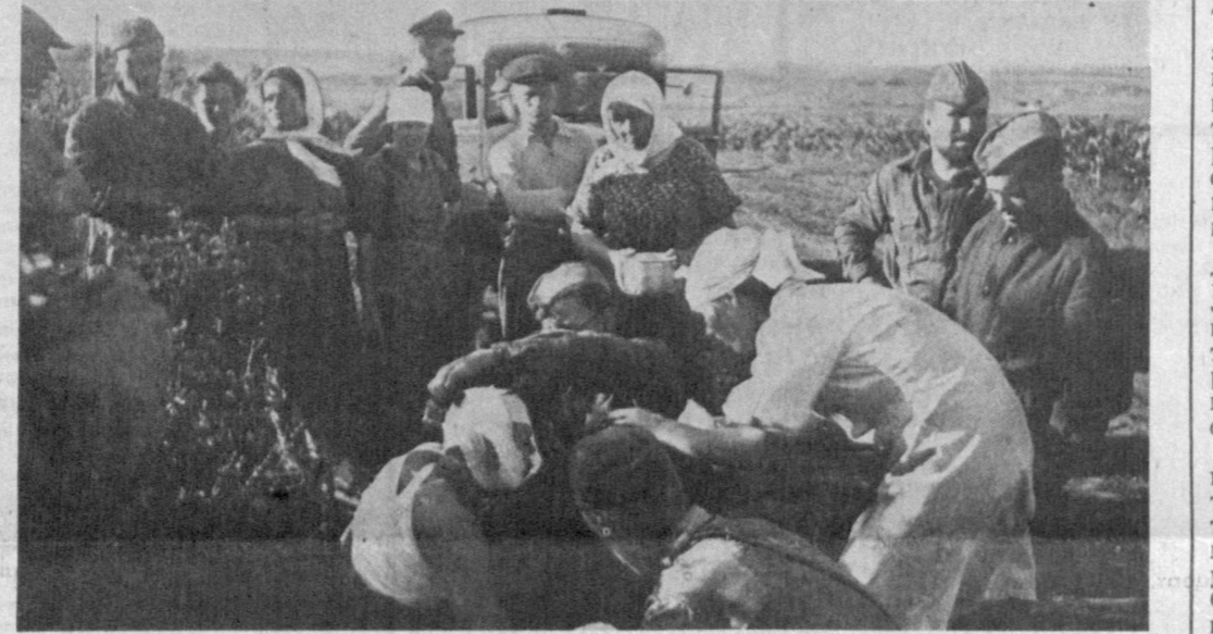
Первые раненые под Кишиневом после воздушного налета фашистов.

С волнением разворачивая нукусские газеты, публикуя фамилии погибших и без вести пропавших в Великой Отечественной войне земляков-воинов, встречаю порой дорогие сердцу имена товарищей по далекой школьной юности.