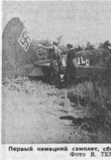
Первый немецкий самолет, сбитый в районе Киева.

прошли даже полного курса в средних военно-учебных заведениях. Красная Армия, вынужденная отступать под натиском немецких войск, тем не менее постепенно усиливая сопротивление. В ходе боя пришлось ей навстречать ученикам до войны, просто учиться воевать. От нее потребовались поистине героические усилия, чтобы в исключительно трудных условиях отражать мощные удары немецких войск и их союзников, неся огромные по-