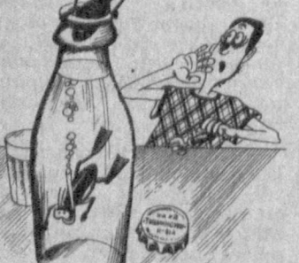
Рис. А. СУХАРЕВА.