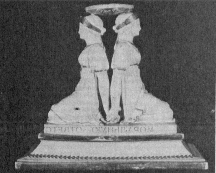
Иллюстрация к статье о фарфоре.

НА СНИМКАХ: канделябр из сервиза ордена Георгия Победоносца (1778 год); декоративная ваза с росписью В. Мещерякова (1836 год); подставка для вазы-фруктовницы из «Гурьевского сервиза» (первая половина XIX века); предметы чайного сервиза завода М. Дунашова (середина XIX века).