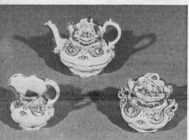
Иллюстрация к статье о фарфоре.