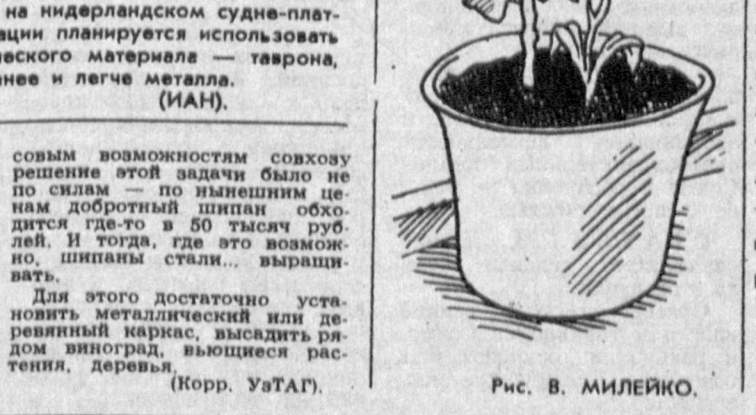
Рис. В. МИЛЕЙКО.

Совхоз имени Тургуня Ахмедова — единственное в Комсомольском районе добротный шипан обкозаче в 80 тысяч рублей. И тогда, где это возможно, шипаны стали... выращивать. Для этого достаточно установить металлический или деревянный каркас, высадить рядом вишню, выходящие растения, деревья. (ИАН).