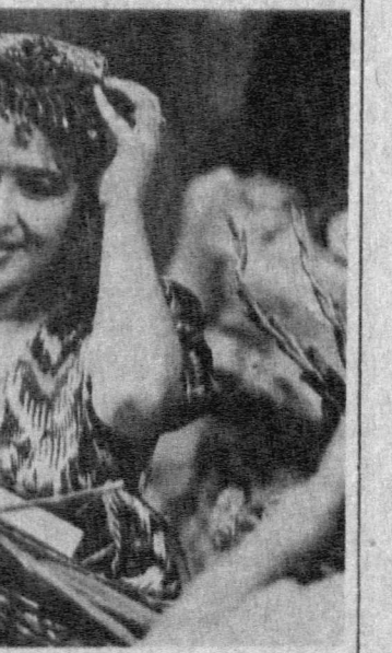
КТО ЛУЧШЕ ЗНАЕТ НАВОИ? ТАШКЕНТ. Во Дворце дружбы народов СССР имени В. И. Ленина прошел фестиваль конкурсов «Семь планет — семь красавиц», посвященный 550-летию Алишера Навои. Участники конкурса продемонстрировали свои знания творчества великого поэта. Организаторы — центр досуга, культурно-социальных мероприятий и социальных инициатив «Саодат» совместно с ассоциацией «Агро-прогресс».

го и безнаказанного использования валюты, других финансовых нарушений, допущенных дирекцией межотраслевой региональной ассоциации внешнеэкономических связей «Фергана». В редакцию поступил ответ прокурора Ферганской области Я. Ж. Жалапова, в котором он сообщает, что по фактам, приведенным в газете,