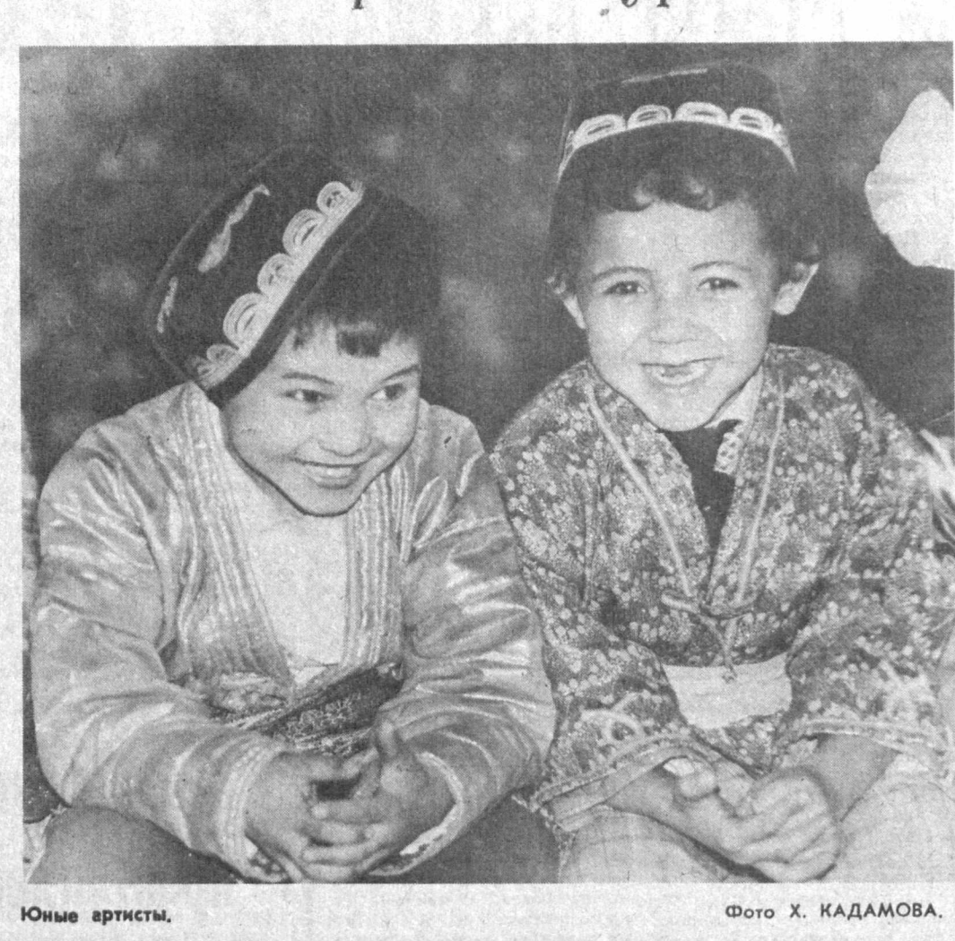
Юные артисты.