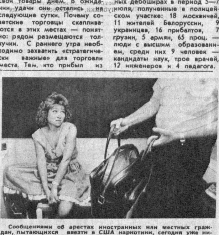
Сообщения об арестах иностранных или местных граждан, пытающихся везти в США наркотики, сегодня уже не удивляют. Они появляются на страницах газет чуть ли не ежедневно и привлекают внимание читателей лишь тогда, когда речь идет об особо крупных партиях кокаина и других сильнейших стимуляторов, средствах или о поимке членов очередной международной шайки торговцев «белой смертью». Ежегодно в Соединенных Штатах конфискуется на таможенных пунктах кокаина и других наркотических средств, уничтожаются в Латинской Америке сотни тысяч гектаров засеянных марихуаной и конопой, ликвидируются десятки подпольных лабораторий, арестовываются главаря подпольной мафии и «родовые» наркобароны. Но ни продолжают процветать, принося колоссальные барыши. НА СНИМКЕ: эта женщина была задержана таможенником Майского аэропорта при попытке веза кокаина в США. Фотохроника ТАСС.

ПЕРЕД нами материалы, поступившие из РОВД Чиланзарского района Ташкента. На одного из юных жителей нашего 8-го квартала возбудили уголовное дело. А в объяснении всем знакомые мотивы. Родители не доглядели. Школа не научила. Комсомол не воспитал. Коллектив проморгал. Товарищи подвели. Государство не обеспечило. Выработанная прежней жизнью привычка делить на себя ответственность и на себя полагаться, по нашему мнению, причина многих бед в самых разных сферах. Созданная на квартале служба общественного самоуправления отрицает этот принцип — вот что в ней самое главное. После многолетних бесплодных хождений и жалоб в жэу, в райисполком, в райком партии и так далее мы решили взяться за хронические бытовые проблемы сами. А расширение прав общественных организаций, махаллинских комитетов сыграло для этого нормативную базу. Инициативу проявила территориальная парторганизация, взяла на себя подготовку хода жителей. На складе провели альтернативные выборы нового состава квартального комитета, поскольку прежний не оправдал своего существования. С тех пор территориальная парторганизация и квартальный комитет действуют совместно, забота ведь общая: обеспечить людям нормальный уровень жизни. И во многих случаях, чтобы помочь, оказалось достаточно просто желания «думать в другую сторону» — не как отказав, а как, несмотря на сложность, сделать. Семидесятилетний Ф. М. Паршутин просил о телефонном известии, чтобы возраст вынуждает становится домоседом,