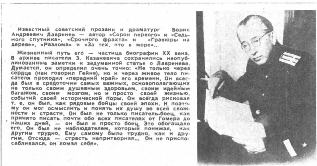
Известный советский прозаик и драматург Борис Андреевич Лавренко — автор «Сорок первого» и «Седьмого спутника», «Срочного фрахта» и «Гравюры на дереве», «Залом» и «За тех, кто в море»...