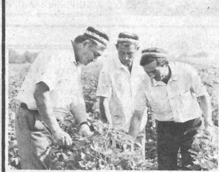
СУРХАНДАРЬИНСКАЯ ОБЛАСТЬ. Полным ходом идет подготовка и «белой страды» на полях хлопководческого совхоза имени И. Муратова Шерабадского района. На всех 3 тысячах гектаров хлопкового клина завершается третья вегетационная обработка растений. Первыми в республике здесь начали чеканку хлопчатника.