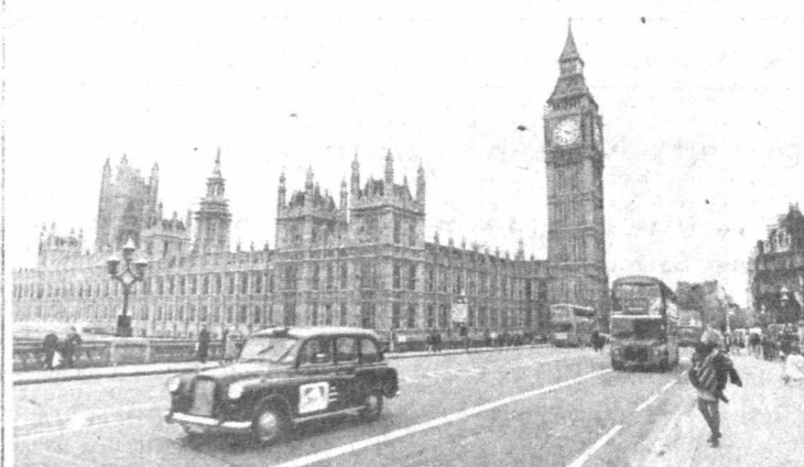
ЛОНДОН СЕГОДНЯ Город на Темзе уже давно играет огромную роль в политической, экономической и культурной жизни не только Британии, но и всего мира. Здесь открылась встреча руководителей «семерки». НА СНИМКЕ: британский парламент — знаменитый Виг-Бем.