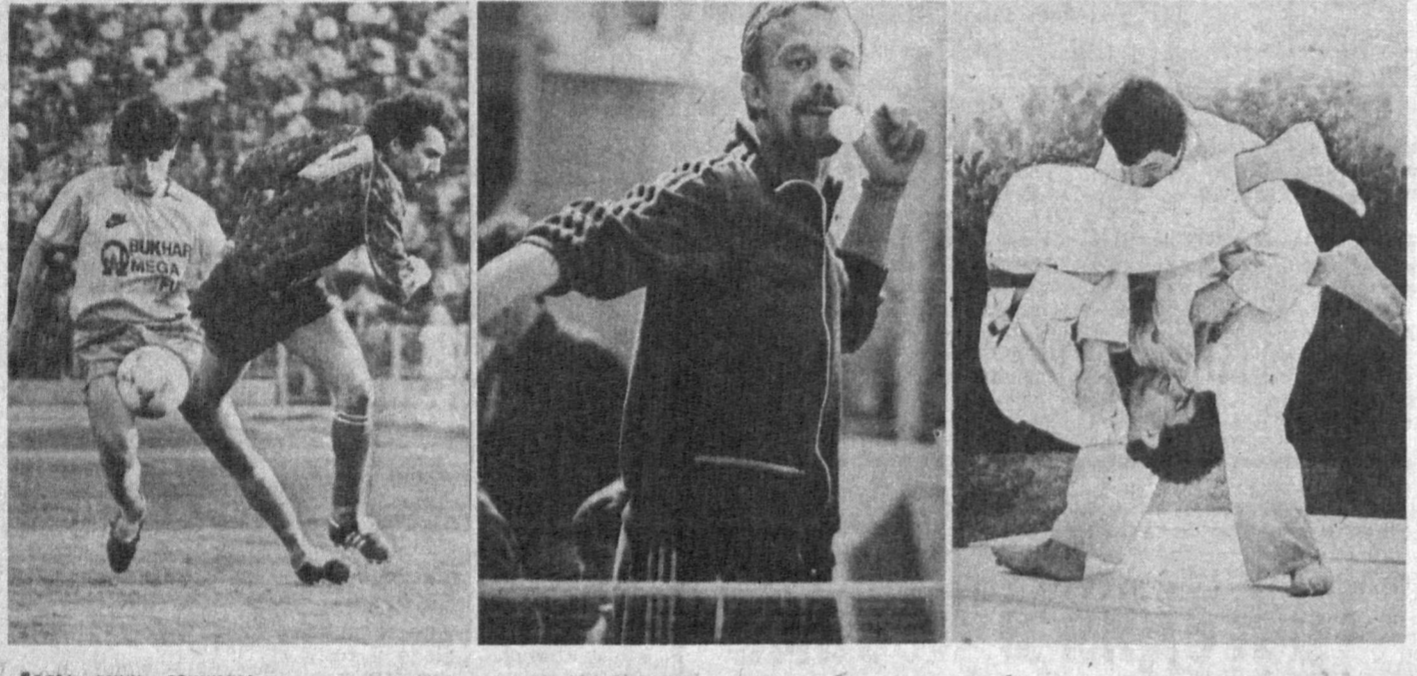
Голы, очки, секунды...