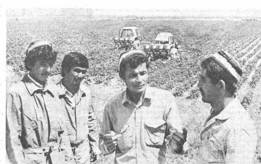
СУРХАНДАРЬИНСКАЯ ОБЛАСТЬ. Весь хлопковый клин в 1,600 гектарах в совхозе «Гулбахор» Термезского района передан арендаторам. Сейчас здесь идет треть комплексная обработка растений.