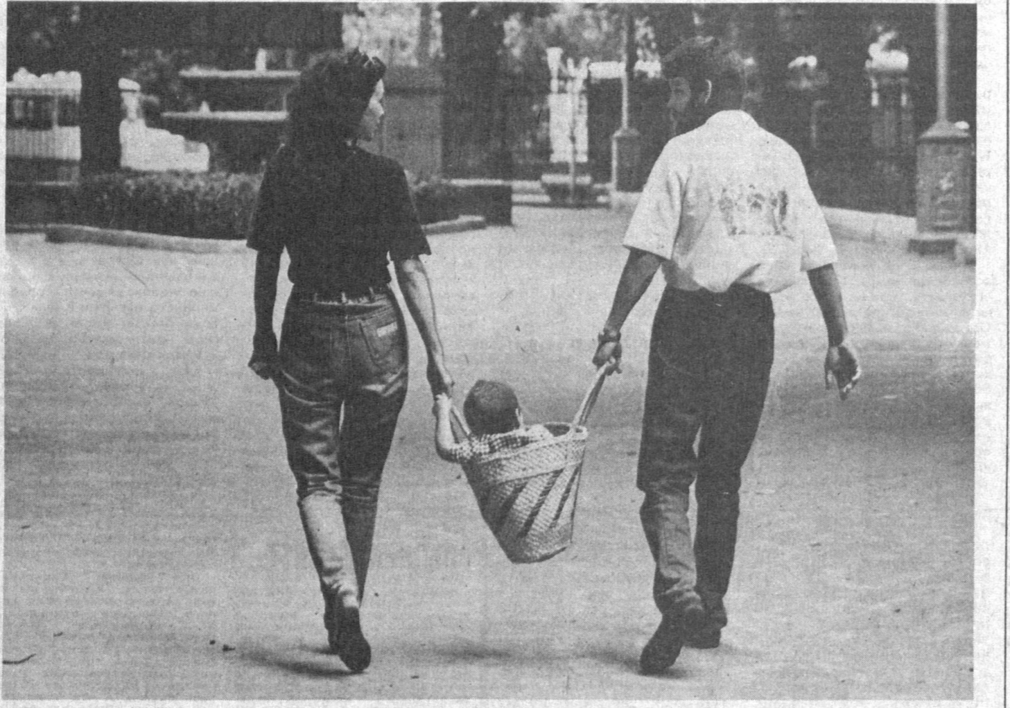
Своя ноша не тянет.

«Гражданский» брак — до горького конца. Перевел С. ВЫКОВСКИХ. (ИАИ).