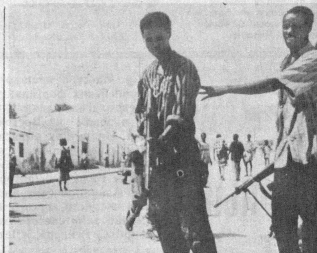
В Сомали продолжается вооруженное противостояние между сторонниками бывшего президента страны Мохамеда Сиада Барре и несоциалистическими группировками, ведущими борьбу с остатками войск свергнутого режима.

«Израильский «КОЛХОЗНИК» ПРЕДЛАГАЕТ» в киббуце каждая из трехсот коров дает по 30 литров молока в день, у нас же — в пять-шесть раз меньше.