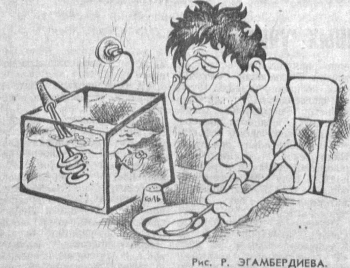
Рис. Р. ЭГАМБЕРДИЕВА.

ДИПЕЦКИ. Н. Писарева из села Грачевка Усинского района покорила мужа. Но свидетельство о его смерти она получила только после того, как по требованию местного сельсовета сдала талоны на табачные изделия, выделен-