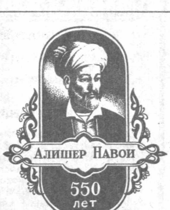
АЛИШЕР НАВОИ 550 лет