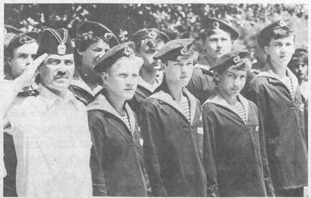
ТАШКЕНТ. В Ташкентской морской школе ДОСААФ Узбекской ССР состоялось торжественное посвящение в курсанты...