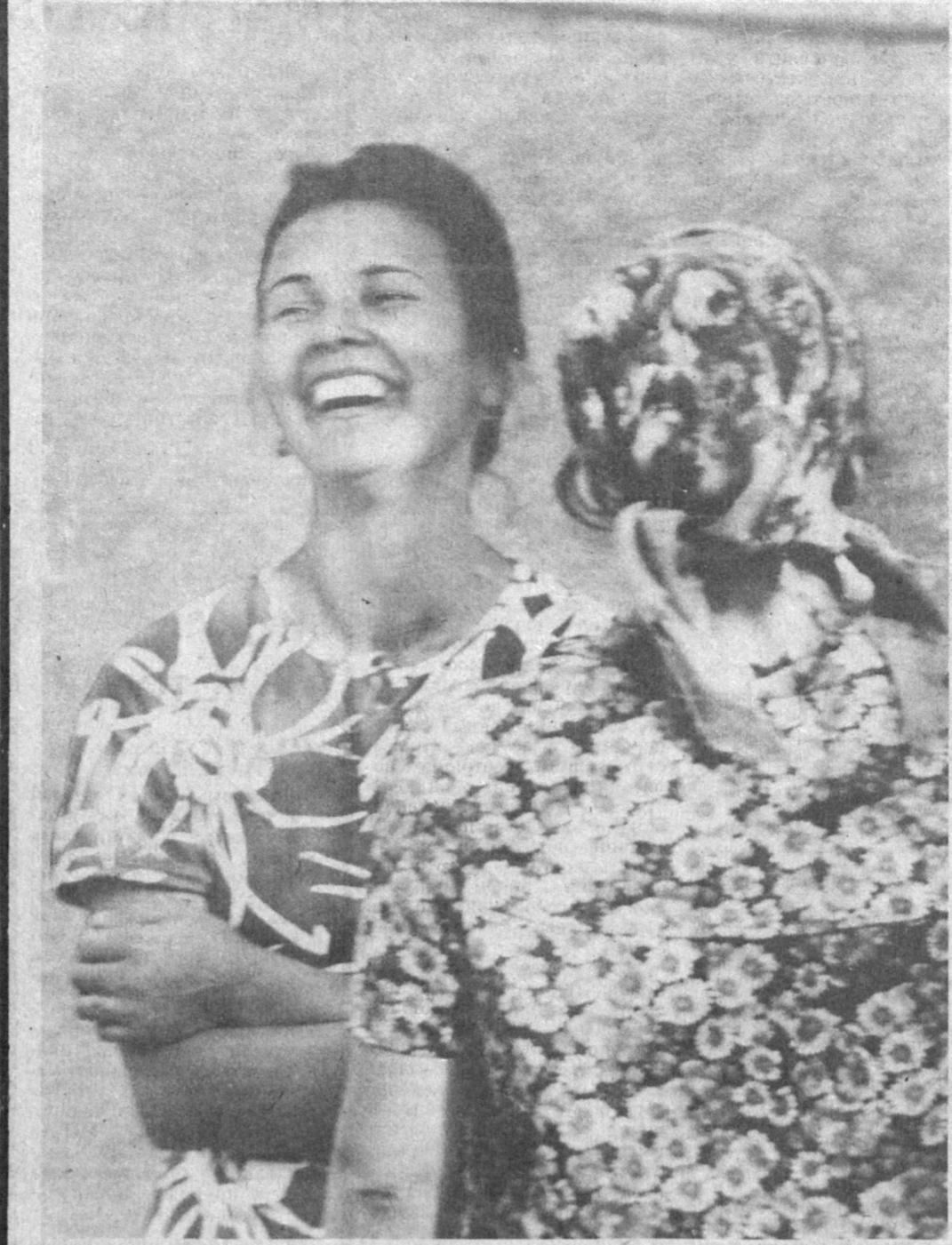
По секрету — всему свету.