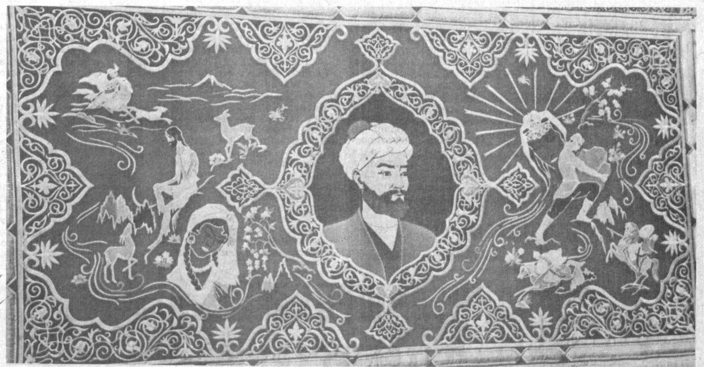
Панно в Государственном музее литературы имени А. Навои, выполненное коллективом Бухарской золоташвейной фабрики.