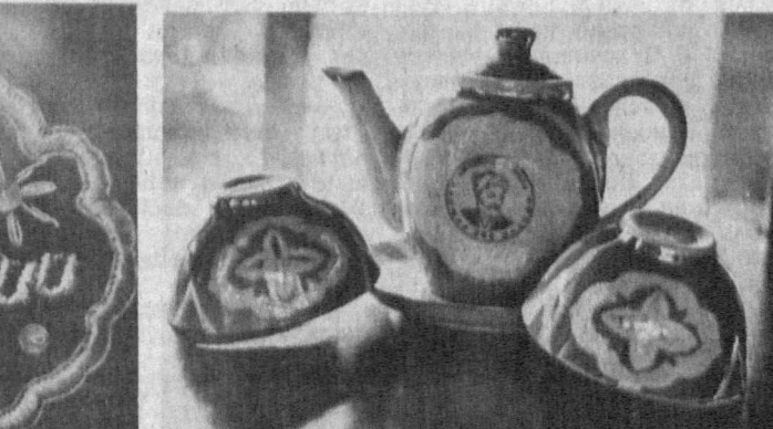
Мотивы творчества Навои, его восприятие мира, тонкости человеческих взаимоотношений...