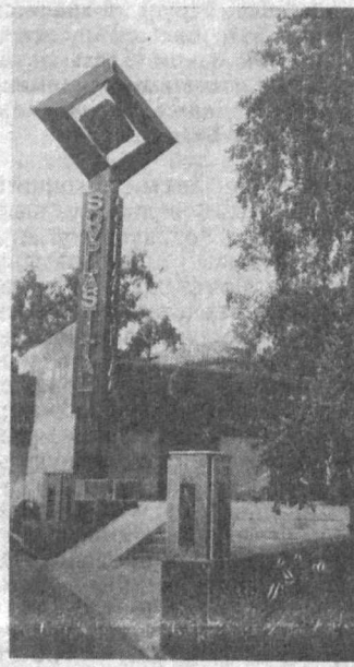
НА СНИМКАХ: Москва, улица Латынина Бабушкина, 9. Магазины «Совпласттала».