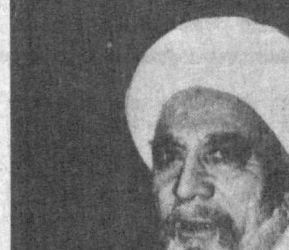
НА СНИМКЕ: народный артист СССР З. Мухамеджанов в роли Навои в спектакле театра имени Хамзы «Алишер Навои» (пьеса Уйгуна и И. Султана).