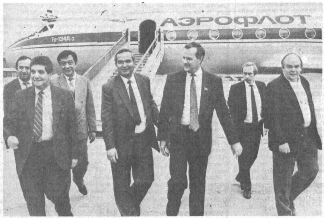
НА СНИМКЕ: встреча в аэропорту.

В ходе переговоров был затронут широкий круг вопросов о положении в стране и Узбекистане, развитии торгово-экономического и культурного сотрудничества.