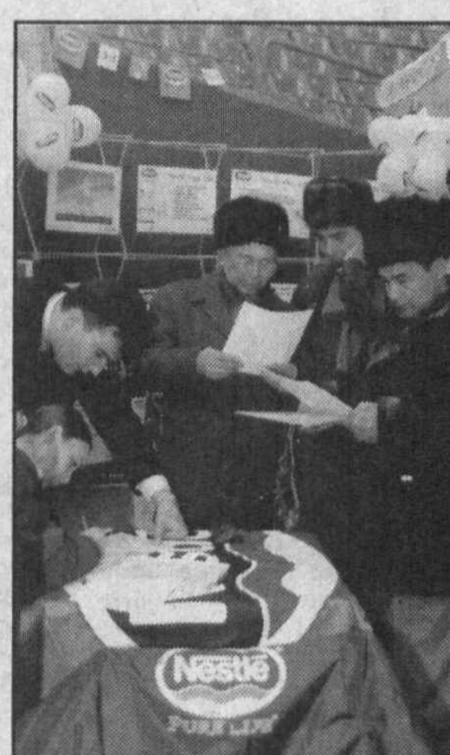
НА СНИМКАХ: ярмарка продовольственных товаров; оформление договоров с представителями СП «Нестле».

Выставочные прилавки выглядят ярко и привлекательно в плане дизайна, упаковки, тары в последние годы также сделано очень много. Соблюдены мировые стандарты по указанию способов приготовления и употребления, срока годности и штрихового кода. Ярмарка продлится неделю, до 15 декабря. За это время производители смогут обговорить все условия договоров с оптовиками, торговлей, предпринимателями на следующий, 2003 год.