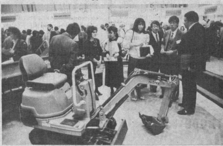
OYO oyo corporation