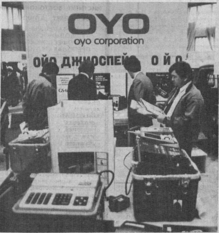
OYO ДЖИОСПЕЙ OYO