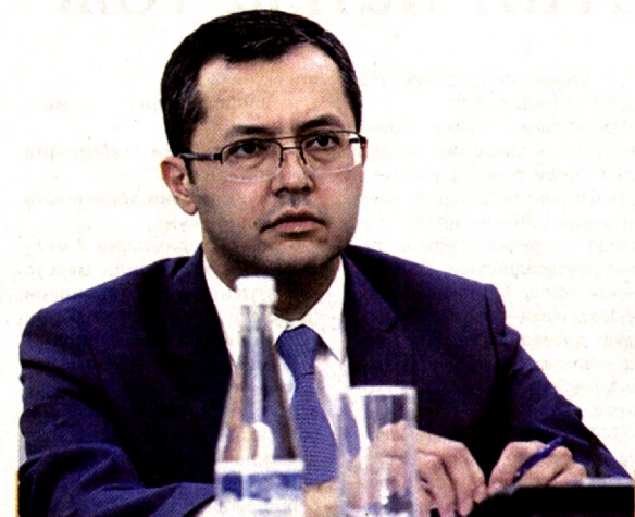
Тимур ИШМЕТОВ, Ўзбекистон Республикаси Молия вазир:

... Биринчи ярим йил яқунлари бўйича давлат харажатлари япйи ички маҳсулотга нисбатан 25 фоизни ташкил қилган бўлса, давлат ташқи қарзи йил бошига нисбатан 11 фоизга ортиб, 17,3 млрд. АҚШ долларига етди.