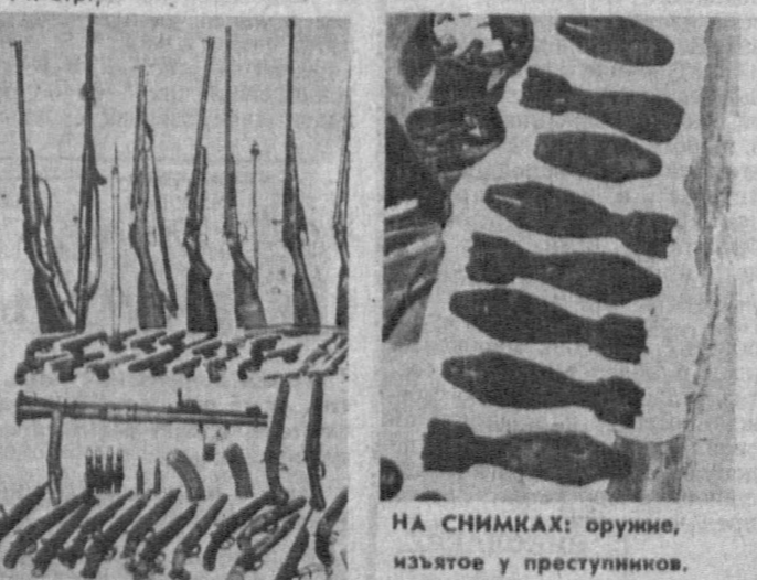
НА СНИМКАХ: оружие, изъятое у преступников.

[О том, как было раскрыто это преступление, читайте на 4-й стр.]