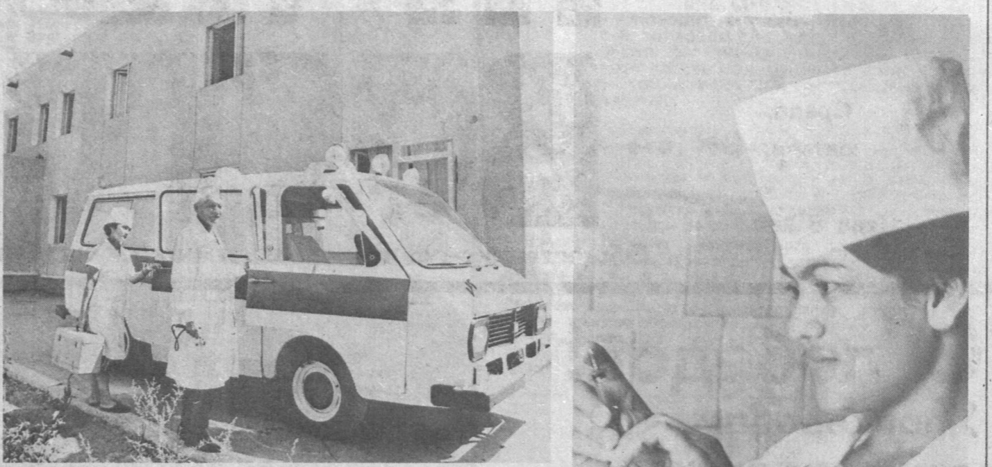
ФЕРГАНСКАЯ ОБЛАСТЬ. Новая сельская врачебная амбулатория открыта в колхозе имени К. Маркса Бувайдинского района. Теперь жители хозяйства, более 13 тысяч человек, получают медицинскую помощь...