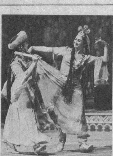
ТАШКЕНТ. Во Дворце дружбы народов СССР имени В. И. Ленина состоялся большой благотворительный концерт...