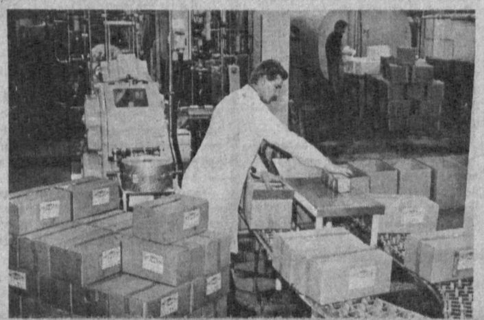
ИЗМУРАНСК. Производство пищевого масла «Атланта» освоило совместное советско-норвежское предприятие «Аритин буд нампени». Сырьем для него служит рыбий жир, в который после очистки по специальной технологии добавляются пищевые добавки. По вкусовым качествам «Атланта» напоминает сливочное масло, но имеет ряд преимуществ, насыщено витаминами «А» и «Д», не содержит холестерина. Масло неземанно при выпечке, потому что не пригорает. Но мурманские хозяйки сетуют, что гнущая это масло удается не всем, так как предприятие пока выпускает 10 тонн в сутки.