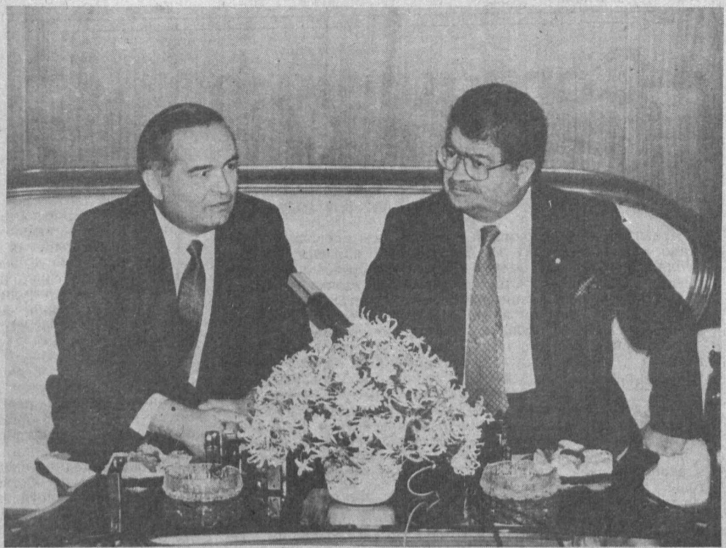
НА СНИМКЕ: Президент Республики Узбекистан И. А. Каримов и Президент Турецкой Республики Т. Озал.