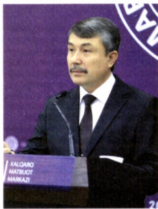
Шуҳрат СОДИҚОВ, Ўзбекистон Республикаси ахборот технологиялари ва коммуникацияларини ривожлантириш вазирининг ўринбосари

Рақамли иқтисодиётни шакллантириш зарури индустриаллаш, кўп маблаг ва меҳнат ресурсларини талаб этиши, бироқ қанчалик кийин бўлмасин, бу ишга бугун киришишимиз зарурлиги, шу боис, рақамли иқтисодиётга фаол ўтиш келгуси энг устувор вазифаларимиздан бири бўлиб қолиши таъкидланди. Чунки рақамли технологиялар маҳсулот ва хизматлар сифатини оширади, ортиқча харажатларни камайтиради. Шу билан бирга, энг оғир иллатлардан бири — коррупция балосини йўқотишда ҳам самарали восита бўлиб хизмат қилади.