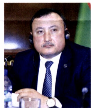
Икром МУСЛИМОВ, Олий суд раисининг ўринбосари

Президентимизнинг ушбу фармонида белгиланган вазифа ва чора-тадбирларнинг амалга оширилиши фуқароларнинг жиноят иш юритуви жараёнидаги конституциявий ва процессуал ҳуқуқ ҳамда эркинликларини том маънода кафолатлайди. Бу айни пайтда тегишли тезкор қидирув органлари, суриштирув, дастлабки тергов ва суд ходимларининг масъулият ва жавобгарлигини бир неча қарра оширади. Уларнинг фаолияти мезони сифатида жиноятларни ҳар қандай усул билан очиб эмас, балки ҳар бир шахсининг ҳуқуқ ва эркинлиги олий қадрияти бўлиши кераклигини ҳуқуқий жиҳатдан кафолатлайди. Бунинг натижа-сида эса шимдат билан ривожланаётган мамлакатимизда қонун устуворлиги ҳамда адолат қарор топишига эришилади.