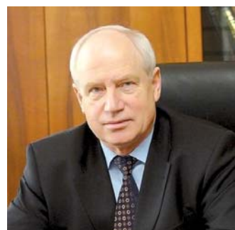
Сергей ЛЕБЕДЕВ, председатель Исполнительного комитета — исполнительный секретарь СНГ:

— Хочу отметить активную и плодотворную деятельность Узбекистана в области обеспечения прав человека. Нынешний самаркандский форум, ориентированный на защиту интересов молодежи в глобальном масштабе, — наглядное тому подтверждение. В повестку дня конференции вынесены наиболее актуальные вопросы совершенствования механизмов защиты прав нового поколения, а также усиления роли молодежи в обеспечении Целей устойчивого развития ООН. Важной темой встречи является развитие всемирной программы образования в области прав человека.