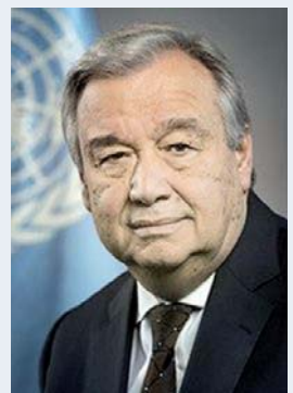
Антониу ГУТЕРРИШ, Генеральный секретарь ООН:

Работа над проектом Конвенции продолжалась более двух лет. Был изучен накопленный в этом направлении региональный и передовой опыт зарубежных стран, проведен ряд международных консультативных мероприятий. Конвенция представляет собой новый унифицированный документ международно-правового акта, нацеленного на формирование и реализацию молодежной политики в условиях глобализации и бурного развития информационно-коммуникационных технологий, отражающий специфические права молодежи, необходимые к признанию в современном мире. Наличие меж-