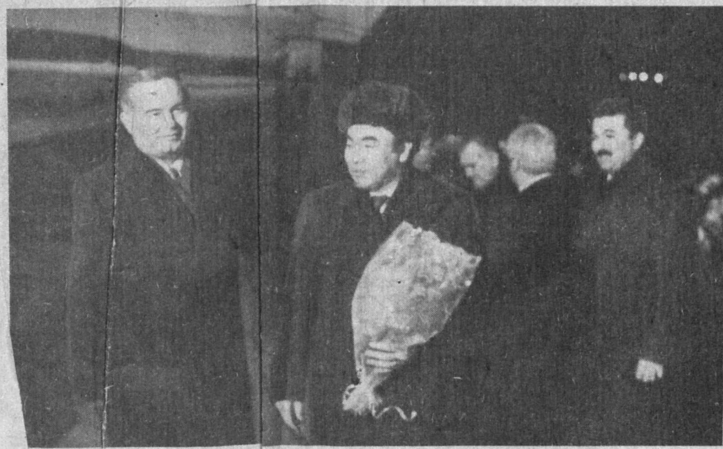
Ўрта Осиё ҳамда Қозоғистон мамлакатларининг давлат ва ҳукумат бошлиқлари Тошкентга ети келдилар. Бу учрашув тарих саҳифаларига муҳрланди.

Бу мамлакатлар давлат ва ҳукумат бошлиқларини аэропорлда Ўзбекистон Республикаси Президенти Ислол Каримов, Бош вазир Абдулқошим Муталов, Ўзбекистон Республикаси Олий Кенгаши Раиси Шавкат Йўлдошев, бошқа расмий кишилар кўб олдилар.