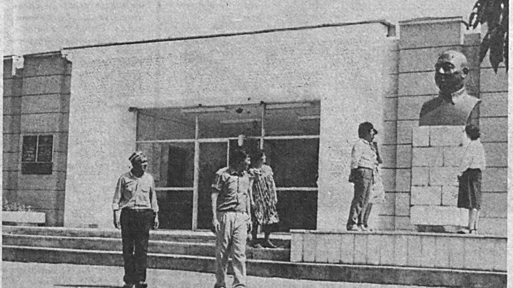
Фарғона районидagi Усмонобод қишлоғида партия ва давлат арбоби У. Юсуповнинг уй-музейи ишлаб турибди. Зияратта нафақат Ўзбекистон аҳолиси, балки хоржий мамлакатлардан ҳам таширф буюрувчилар кўпаймоқда. Афғонистон, Болгария, Сурин, Вьетнам сингари мамлакатлардан келган сайёҳлар музейга қўйилган ҳужжат ва суратлар билан танишишгач, У. Юсуповнинг халқаро давлат арбоби бўлганлигини таъкидлашди. СУРАТЛАРДА: музей директори суратлар билан танишишгач, У. Юсупов ҳақида сўзлаб берапти; музейнинг умумий кўриниши.