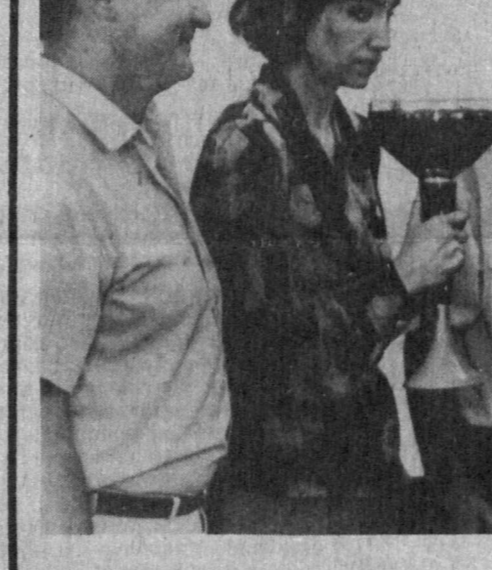
ТОШКЕНТДАГИ «МАЛИКА» ТРИКОТАЖ ИШЛАБ ЧИҚАРИШ БИРЛАШМАС РАҲБАРЛАРИ ЖАМОАДА СПОРТ БИРАМОННИ РИВОЖЛАШТИРИШГА АЛОҲИДА ЭЪТИБОР БЕРМОҚДАЛАР. У ЕРДА СПОРТИНГ ФУТБОЛ, ВОЛЕЙБОЛ,

— Болалар кўз олдида аёлинига қўлоқ гаплар айтиб танбех берганимиз?