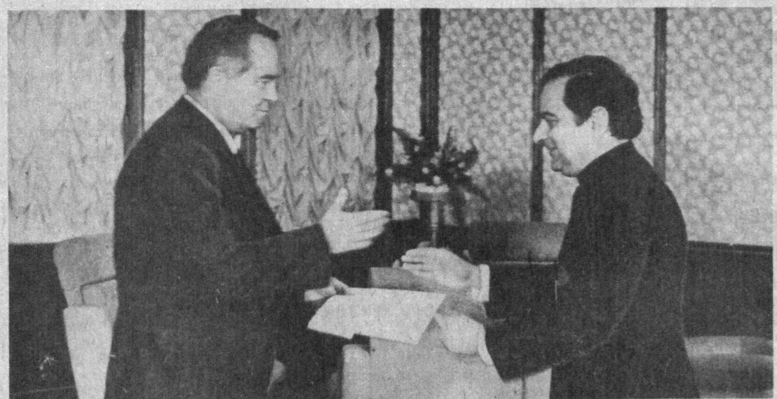
СУРАТДА: Ишонч ёрлигини топшириш пайти.

12 январь куні Ҳиндистон Республикасининг Ўзбекистон Республикасидаги фавқулодда ва мухтор элчиси этиб тайинланган Далип Мехта мамлакатимиз Президенти Ислам Каримовга ишонч ёрлигини топширди.