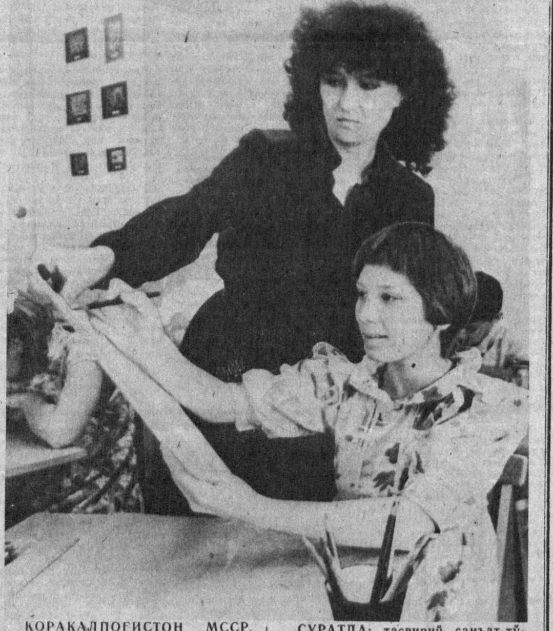
ҚОРАКАЛПОГИСТОН МССР. Ҳўжайли шаҳридаги Хамаза Ҳакимзода Ниёзий номи болалар уйда уч ёшдан етти ёшгача бўлган ўғил-қизлар тарбияланади. Бу ерда турли тўғарақлар ишлаб турибди.