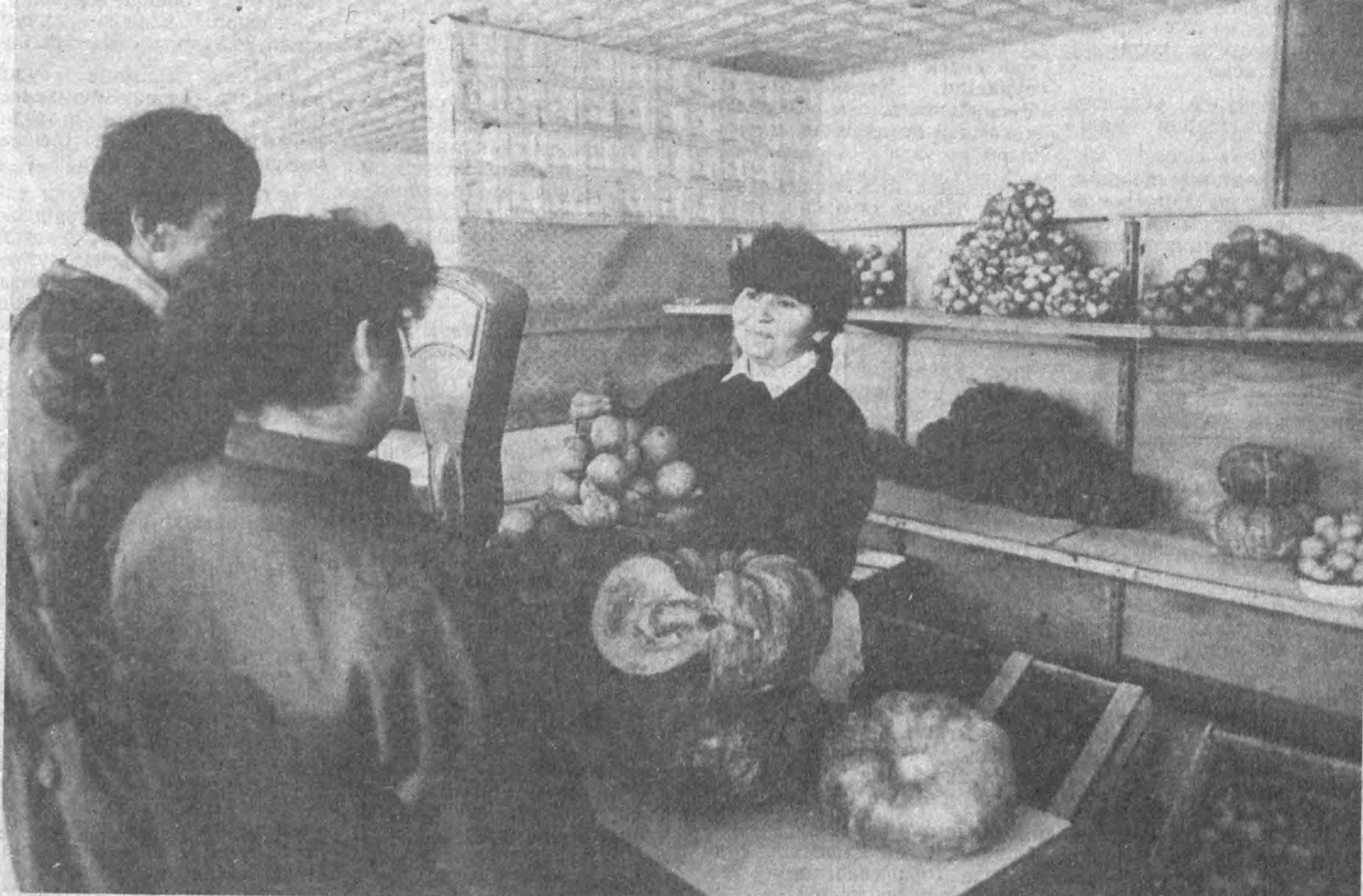
«Узплодоовосчвинпром»нинг Сирдарё вилояти бирлашмаси аҳолини деҳқончилик ва бодғорчилик маҳсулотлари билан муттасил таъминлаб туриш мақсадида 1726 тонна картошка, 393 тонна мева, 221 тонна узум, 2447 тонна тарвуз-қовун сақлаб, савдо тармоқлари орқали истеъмолчиларга етказмоқда.

Молдова Халқ жаҳаси раҳбари Мирча Друк Руминияда май ойида бўладиган умумхалқ сўлоҳларида ўз номзодини кўйиш ниятида.