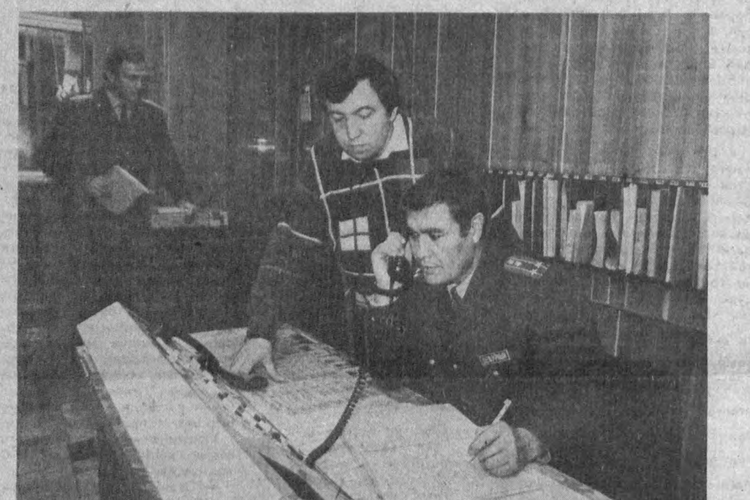
ПОИТАХТДАГИ Ҳамава район совети ижроия қомитети ички ишлар бўлими қонда ҳудудий милиция хизмати ташкил этилди. Янги хизмат иш бошлаган қисқа вақт ичда районда жи-

МАНЗИЛИМИЗ: 700000, ГСП Тошкент шаҳри Ленинград кўчаси, 19-уй. Телефонлар: 32-09-67, 33-07-48. Индекс: 64608. Буюртма № 217. 100000 нусхада чоп этилади.