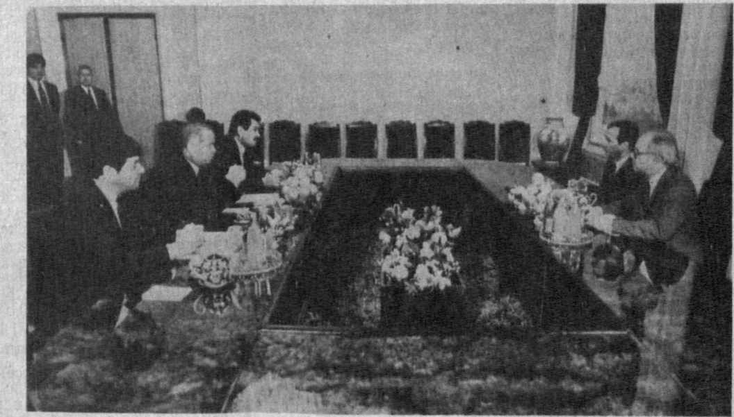
СУРАТДА: қабул пайти.

ЎЗБЕКИСТОН RESPUBLIKASI ПРЕЗИДЕНТИНИНГ ФАРМОНИ С. С. САФОВНИ ЎЗБЕКИСТОН RESPUBLIKASI ТАШҚИ ИШЛАР ВАЗИРИ ЭТИВ ТАЙИНЛАШ ТУҒРИСИДА Сафоев Содиқ Солиҳович Ўзбекистон Республикаси ташқи ишлар вазири этиб тайинлансин. Ўзбекистон Республикасининг Президенти И. КАРИМОВ. Тошкент шаҳри, 1993 йил 2 февраль.