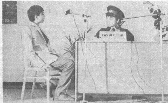
Пойтахтимида «Тошкент хусусий эриклар лицейи» очилганига яқинда ярим йил тўлди. Шу муносабат билан бу ерда тантанали кеча бўлиб ўтди...