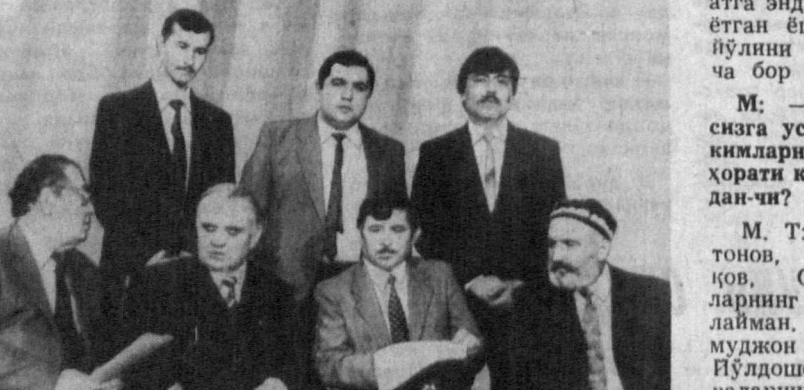
СУРАТДА: «Бобур» видеофильмининг бир гуруҳ ижодкорлари.

«Эх, китоб тутган қўлларга интизор бўласан...» «Эх, китоб тутган қўлларга интизор бўласан...» «Эх, китоб тутган қўлларга интизор бўласан...» «Эх, китоб тутган қўлларга интизор бўласан...» «Эх, китоб тутган қўлларга интизор бўласан...»