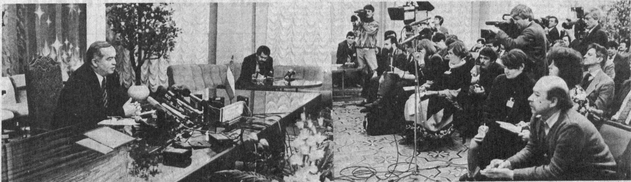
СУРАТДА: Учрашув пайти.

Мустақил Ўзбекистоннинг иқтисодий тараққиёт йўли қандай, республика раҳбарияти пулни қанчалик қўлдан қўймайди, республикада Ислом ақида-растлигининг таъсири борми, Ўзбекистон рубль зонасида қоладими?