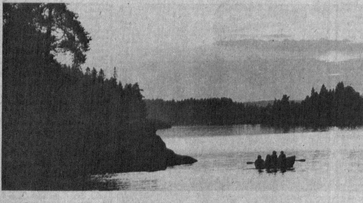
Шимол оқ туллари латиф бир манзара касб этади. Мусасффо қўлларнинг шаффоф сувлари бамисоли оқ лайлақлар қўналғисига ўхшаб кетади...