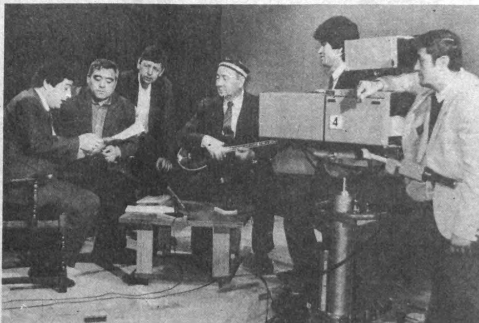
Бу галги Наврўз мустақил Ўзбекистондаги биринчи баҳор байрами бўлади. Уни истиқлол Наврўзи, деб айтиш мумкин. Зора энди юртимизга тўқинлик, фаровонлик кириб келса, юракдаги қат-қат дарду армонлар, тугуллар ёзилса... Ана шундай умидбахш кунларни ҳақ билан баҳам кўриш ниятида ҳар галгидай Ўзбекистон телерадио компанияси «Наврўз» хайрия телемарафонини ўтказиш учун бу дил ҳам катта тайёргарлик кўрмоқда. СУРАТЛАРДА: тайёргарлик жараёни акс эттирилган.