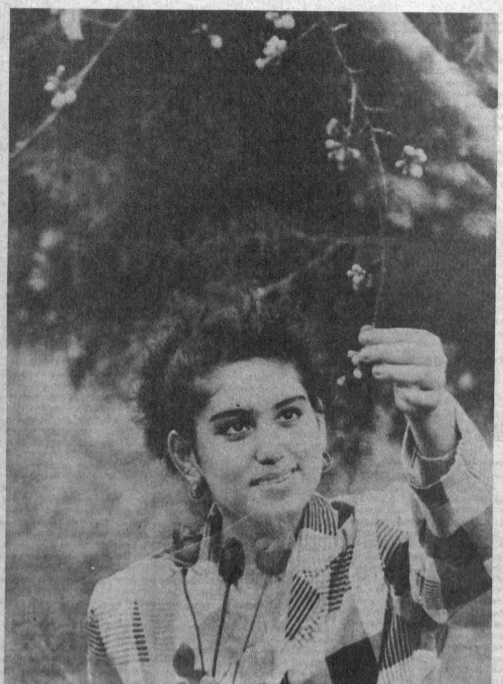
«Сен баҳорни соғинмадингми?..»