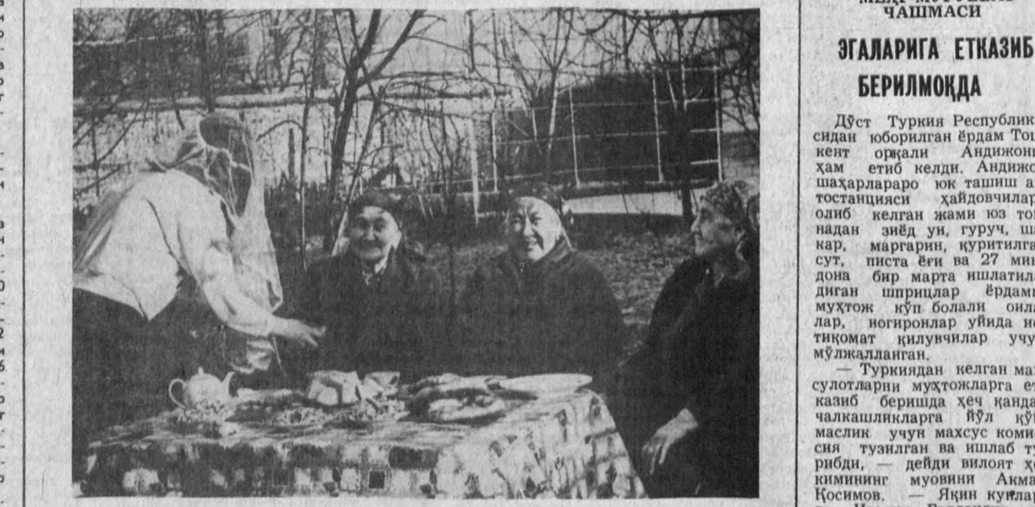
Келинчак саломи.

шлар халқ, бойликлар эса ноҳуд бўлгани қалбимизни гамга тўлатди. Шундай оғир кунда ўзимизни турк бирдорларимиз билан ҳамдард ва ҳамнафас сезаёламиз. Дўстлар бошига тушган қулфат бизнинг ҳам қулфатимиз, дарду аламимиздир.