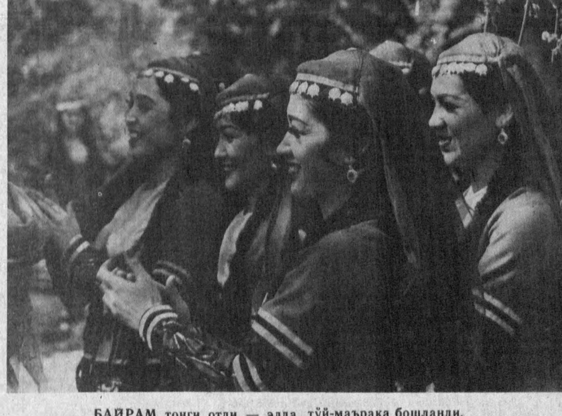
БАЙРАМ тонги отди — элда тўй-маърака бошланди.