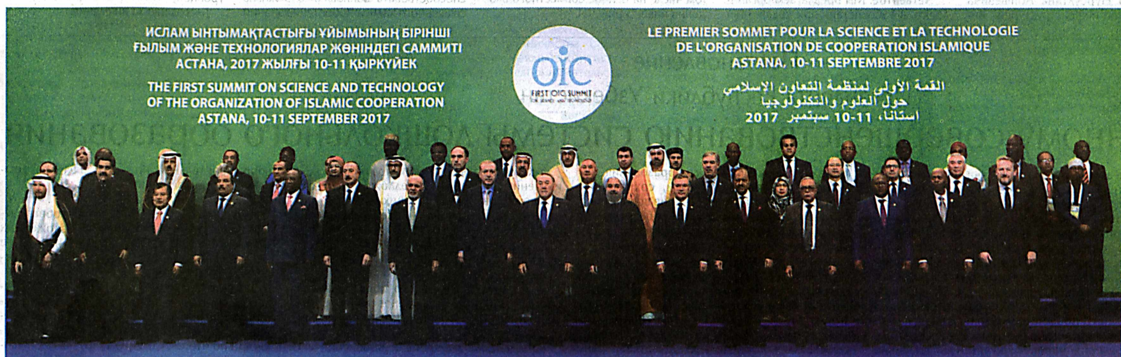
ИСЛАМ БЫТМАҚТАСТЫҒЫ ҰЙЫМЫНЫҢ БІРІНШІ ҒЫЛЫМ ЖӘНЕ ТЕХНОЛОГИЯЛАР ЖӨНІНДЕГІ САММИТИ АСТАНА, 2017 ЖЫЛҒЫ 10-11 ҚЫРКҮЙЕК