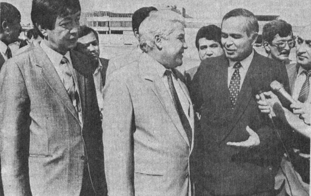
СУРАТЛАРДА: Қозғоғистон ССР, Қирғизистон Республикаси, Тожикистон ССР ва Туркменистон ССР делегацияларини Тошкент аэропортида кўтиб олиш пайғам.