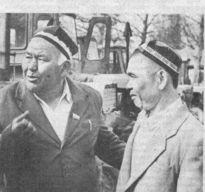
Толбижон ака Ўзбекистон Республикаси Президенти И. А. Каримовнинг Миср Араб Республикасига сафарига ҳамроҳлик қилганди. Пахтакор эмасми, хоржида бўлганида у ердagi ҳамкасблари иши билан қизиқди. Жумҳуриятимизда ишлаб чиқарилган пахта терши машиналарига кўзи тушди-ю, уларнинг қаердан келтирилганлигини сўради. Хорижликлар «Москвадан, Москвадан, дея жаъоб беришди. Шунда Толбижон ака жуда галати аҳволга тушди. Чунки мезбонлар ўзлари фойдаланган пахта терши машиналари Ўзбекистонда ишлаб чиқарилганлигини билишмасди. Сўхбат асосида Толбижон ака юртимизни дунёга тантиши

Бунга сабаб шунки, ишбошилар кўчат сийрак бўлиб қолишдан қўриқиб, дастлаб кўпроқ ниҳол қолдиришади. Кун ўтган сайин майдонларда мўлжалдагидан ортиқ гўза мавжудлиги аён бўлиб қолган, яна ортиқча меҳнат сарфланади. Бу ерда ана шу муҳим арготехник таъбир бир марта амалга оширилди. Ҳар гектар майдонда юз минг тўл қўчат бўлса бас. Бироқ гўзани чилпишда арготехник муддатларга риоя этиш гоёт муҳим. Чунки чеканка эрта ўтказилса, гўза бичкилаб ўсиб кетади. Кечикса, ҳосил ветилиши кўзилади. Шу боис ҳар тўл гўзада ўртача 16 та ҳосил шох, 3 тадан бўлиқ кўсак пайдо бўлганда, бу таъбир тез-