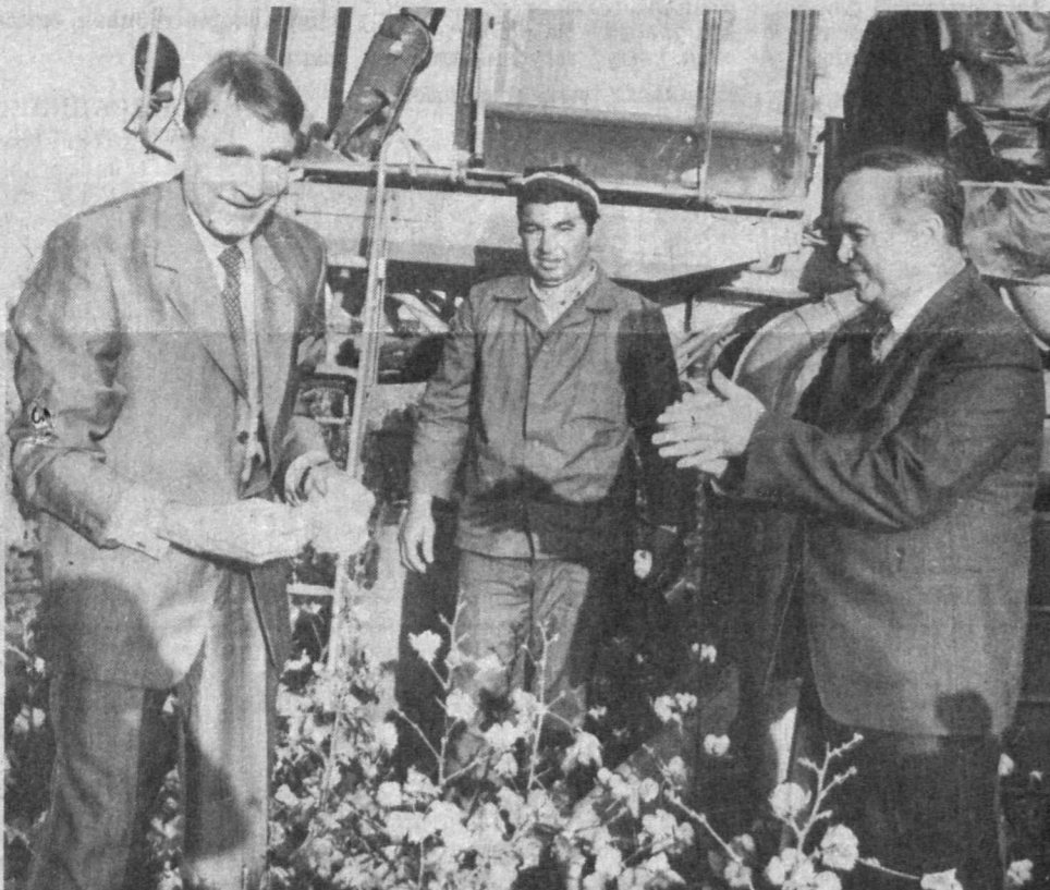
СУРАТДА: Ўзбекистон Республикаси Президенти Ислам Каримов ва Финляндия Республикаси Президенти Мауно Койвисто пажазорда. Ўзбек пахтасининг доғруғи яна бир доводдан ошадиган бўлди!

Ўзбекистон пахтасига ошуватлар кўп, кўз тиканлар бисёр. Эндиликда мустамил мамлакатимизнинг нафқат ички, Балки ташқи стратегиясини ҳам белгилаб бераётган оқолтиришни ёмон кўзлардан асра- сии, ишқилиб.