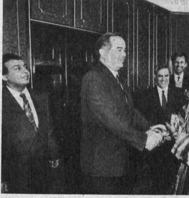
СУРАТЛАРДА: қабул пайти.

Т. БОТИРБЕКОВ, Ўзбекистон Миллий ахборот агентлигининг махсус мухбири.