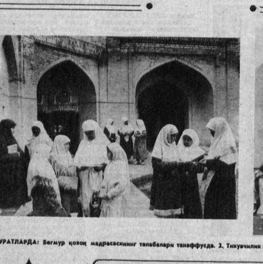
СУРАТЛАРДА: Беғмур қозоқ мадрасасининг талабалари танарафусида. 2. Тикуччилик қаҳда машғулот пайти.

Лекин ҳозирги пайтда атрофимизда биз билан бирга нафас олиб, бирга кун кеңираётган айрим пулдорларнинг йўриғи бошқа. Улар ўзига тўқ, инсоф-дийнатдан анча олиб, даҳшатли томони — улар ўзаро маҳкам уюшган. Маъбуотда ёшиятгандаёқ, ўшалар ҳукумат мўлккалаган ислохотларни барбод қилишмоқда. Тақчиллик ва қимматчиликни юзага келтиришмоқда. Қолаверса, зимдан мамлакатни боқаришмоқда. Шундай экан, биз маънавий қаломатга эришмай туриб, на иқтисодиётни на сивистни кўлга кўя оламиз.