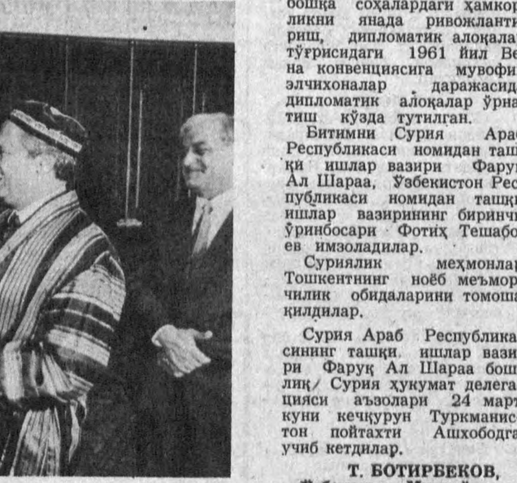
А. ГОРӨКРИК олган сурат.