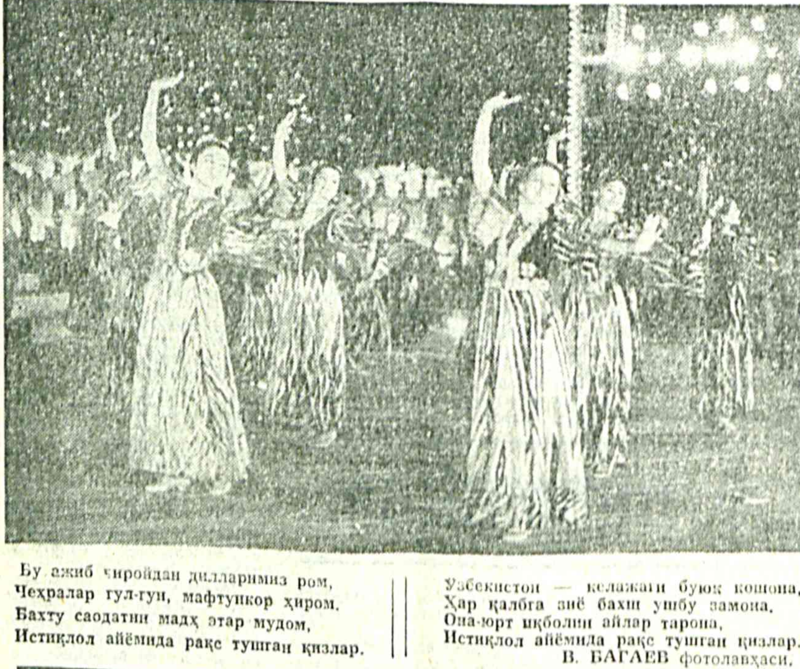
Бу азиб широдан диллариниз ром, Чехралар гул-гул, мафтункор ҳиром, Бахту саодатин мадаг атар мулом, Истиқлол айёмида рақе турган қизлар

Азиздан сен ҳақидаги кўп эсимни дoston мактаб, Эсай уч-тўрт сатр мен ҳам табаруқ ошан мактаб, Остонамга қадим кўйган бегубор гўр гўдақларга, Бериб таълим пиширгайсан, қилиб ақил раван мактаб, Эгарсан барчани турмуш, табиат сиринди воқиф, Ҳамаи илму ҳунар, ақлу одоига кон мактаб, Эзинг ақлу заковатсан, ўзинг табаруқ бўстони, Эзингизни поклаш дилга гурур билан виқдон мактаб, Кўчонингда қилар меҳнат неча хуш хулқ мураббийлар, Забардast олму фозил устозларга макон мактаб, Агар ҳар жаҳода доно ўнги-қизлар урар жавлон, Қилар юрт мушкулни осон, қўшиб шовинга ишон мактаб, Бугун эа бурчинини аъло бақарим, фуқаро етди давр — қайим, талаб — қатий дилчандин салон мактаб, Мен ҳам қўлга қадим олдим, Эсай маҳзинини деб, чунки, Юрак таллинмоғини қўйма, соғиниб, сен томон мактаб, Э. ГОИИБАЗАРОВ.