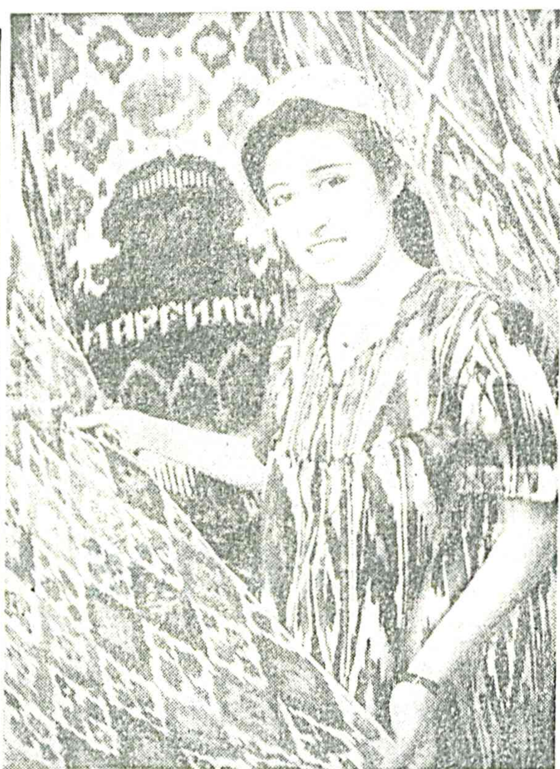
...АТЛАСМИ БУ, Э ҚИЗЛАР НЕОСИ.