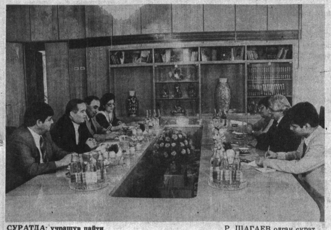
СУРАТДА: учрашув пайти.

Ўзбекистон Республикасининг Президенти И. А. Каримов 21 сентябрь кунин Тошкентдаги хинд савдо кўргазмасида иштирок этган Хиндистон Республикаси ҳукумат делегациясини қабул қилди. Хиндистон Республикасининг СССРдаги факултети ва мухтор элчиси Альфред С. Гонсалес, Хиндистон ташқи ишлар вазирининг ўринбосари Арундхати Гош, Хиндистон Республикасининг Тошкентдаги бош консули Ашок Мукержи қабулда ҳозир бўдилар. Тошкентда хинд саноат кўргазмасининг очилиши ик- ки томонлама иқтисодий алоқаларни кенгайтиришга имкон бериши таянчланди. И. А. Каримов Хиндистонга ташриф буюрганидан сўнг шу мамлакат ҳукумати Ўзбекистоннинг иқтисодий ва ўзга имкониятларига зўр қизиқиш билан қарашини сезганлигини айтди. Бу эса савдо-иқтисодий, маданий, илмий алоқаларни кенгайтириш учун яхши истикболлар очарди. Ўзбекистон мустақиллиги эълон қилинганидан келиб чиқиб, Хиндистон Республикаси ташқи ишлар вазири Ш. Н. Махмудова қатнашдилар. Хинд меҳмонлари Ўзбеки-