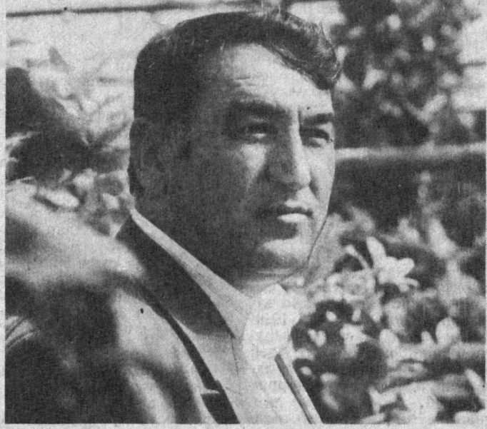
Бухоро районидagi «Маданият» имомов хўжалиги аъзолари ҳар йили барча соҳаларда бошқаларга ўрнак бўларли даражада натижаларга эришиб келмоқда. Ҳосил ўтган йил ҳам ёмон бўлмади. — Ҳозир даладарда иш қизғин, — дейди тўжалик раиси Ўзбекистон халқ депутати Муҳаммадқош Аҳмедов. — Экинчиликлар қийос униб чиққан. Сессиядан қайтсан, парваршиши бошқадан бошлаймиз. Чунки юрт ва мустақилликни тақдир кўп жиҳатдан эроатчиликка боғлиқ. Президентимиз айтганларидай: «Оч одамнинг қулониға мускига кирмайди». СУРАТДА: тўжалик раҳбари, Ўзбекистон халқ депутати М. Аҳмедов. Сессияга бағишланган материалларни газетанинг 2-бетига ўқийсиз.

Қорақалпоғистон Республикасини, вилоят ва Тошкент шаҳридан бўлиш халқ депутатлари гурӯҳлари вакиллари кенгаши бугун, 5 май куни соат 17.30 да Ўзбекистон Республикаси Олий Кенгашининг кичик мажлислар залида бўлади.