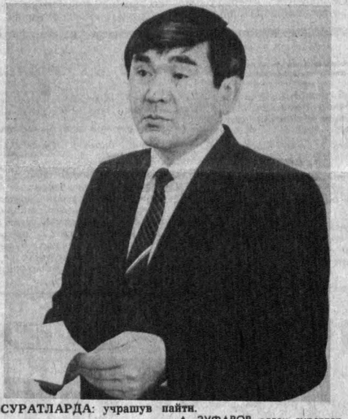
СУРАТЛАРДА: учрашув пайти. А. ЗУФАРОВ олган суратлар.

Халқ сузи ва Народное слово рўзномадагининг Минбулоқдаги мухбирлар кўналгаси асар қилади