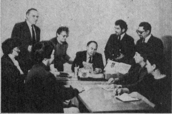
ХАР БИР инсоннинг ҳайда ҳам, иккюда ҳам ўз ўрни бор. Ҳофизга бирининг сози керак эмас, татимайди, иккю ахлининг ҳам ўз қалами бор, ўзгаларники буюрмайди. У ўз қалбига ишонди, қаламига таянди, ўз сўзи, илҳомига содиқ қолади.

Журналист, шоир, адабиётшунос олим Наримон Ҳотамов номини тилга олганда, ҳаёт ва ижод йўлига назар ташлаганда ҳаёлимиз ана шу туйғулар қуршаб олади. У—ҳожатбарор, одам-оҳу, ҳотамтой. Давраларда кўринмай қолса ўрни билдилади. Наримон ака: «Туй-да кўп юрганманд Тўйчубой