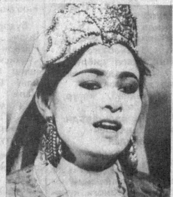
Қин этилди», дейди Ўзбекистон халқ артисти Ғуломжон Хонжиров. Республика Театр арбоб-

Онаси тузалган, уни вилоят театрга ишга таклиф этишди. Дастлаб кичик-кичик ролларда чиқиб юрган актрисага театр бош режиссёри Ғуломжон Хонжиров катта тақлидига Зуҳра ролига таклиф қилди. Бирдан муъжиза рўй берди. «Образ кутилганидан ортиқ даражада тал-