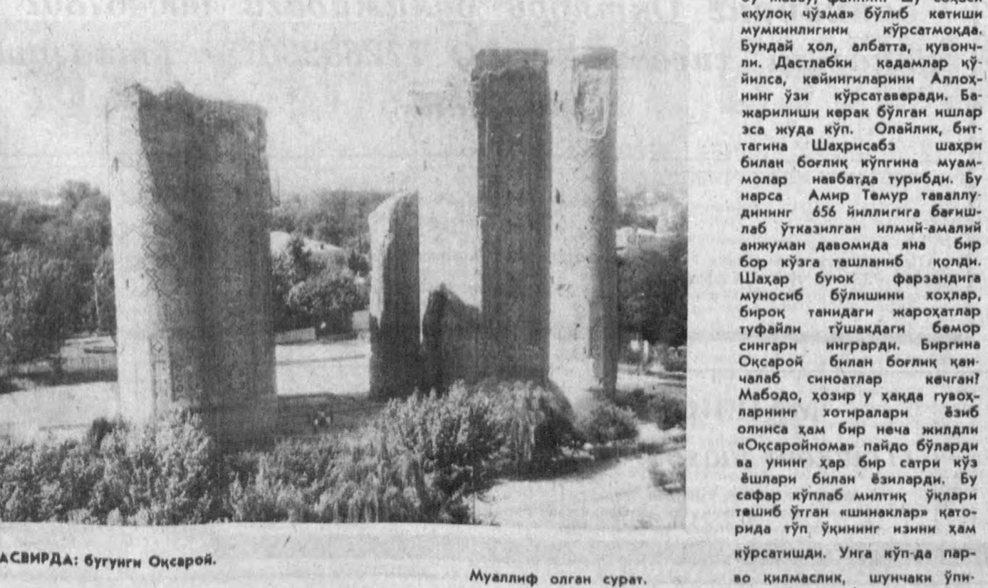
ТАСВИРДА: бугунги Оқсарой.