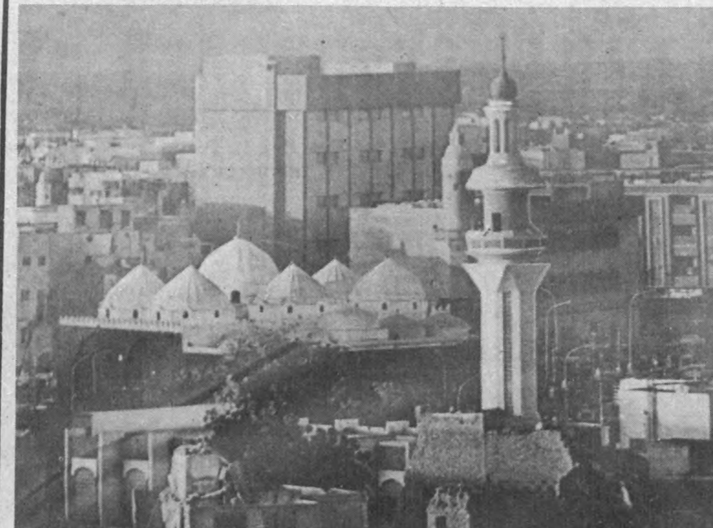
● Ар-Риёд манзараси.