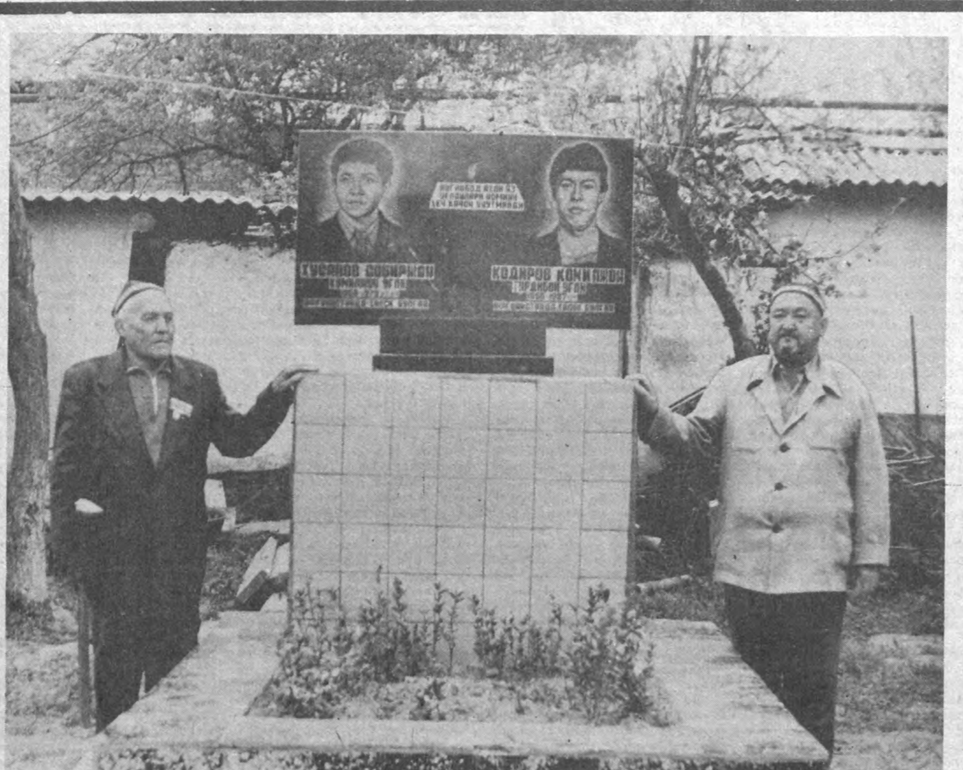
ШАҲИДЛАР ХОТИРАСИ АСЛО ЎЧМАГАЙ

«Афгон» урушидан соғ-омон қайтиш бахтига муваффақ бўлган биз каби йигитлар имтиёзлардан ўз ихтиёри билан фойдаланиш мумкин.