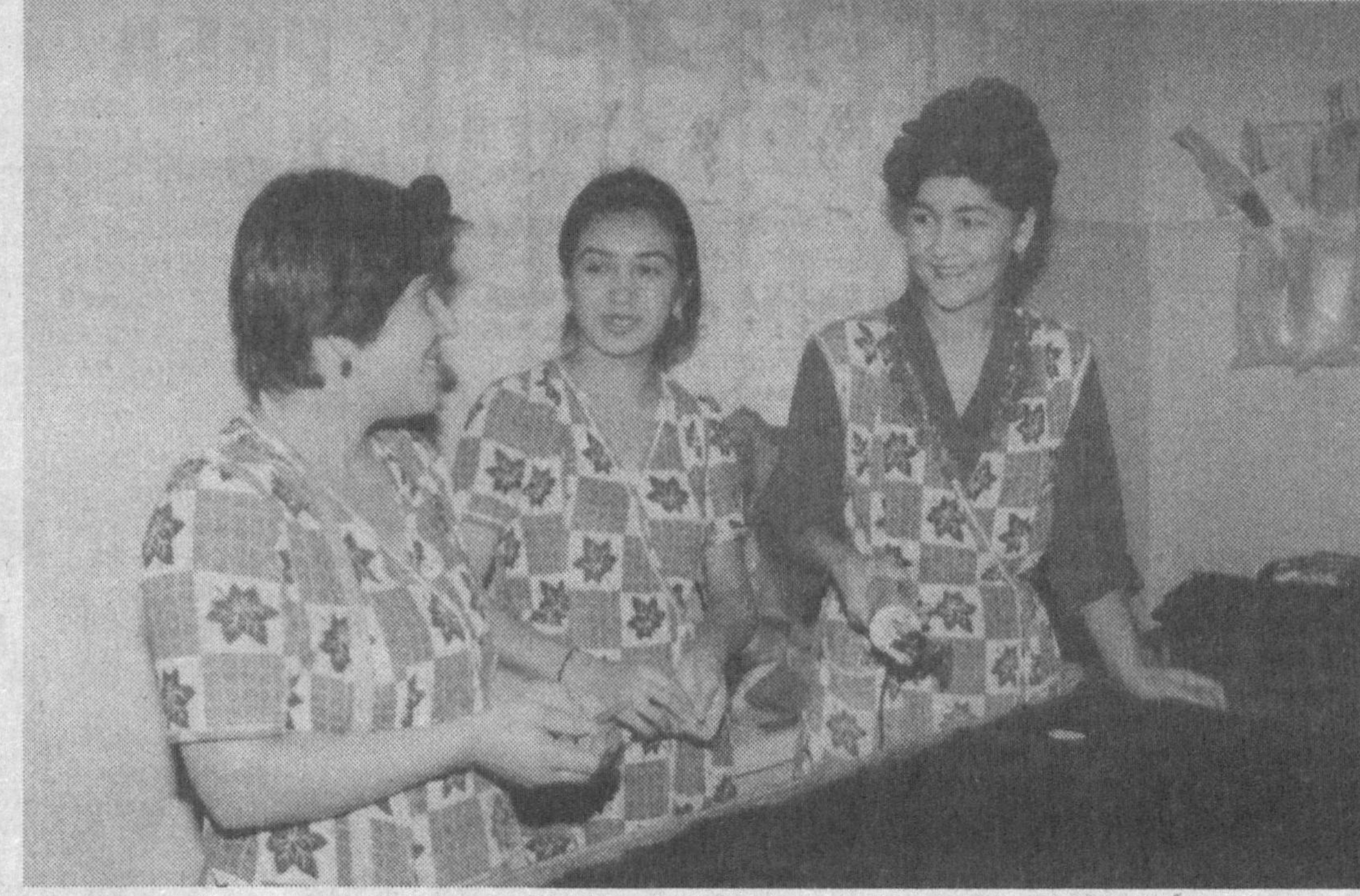
САМАРҚАНДЛИК ҒАЛЛАКОРЛАР - МАРРАДА

Вилоят деҳқонлари давлатга ғалла сотиш бўйича шартнома режасини адо этди. Қабул пунктларига салкам 251 минг тонна сара дон топширилди. Уртача ҳосилдорлик гектарига 52 центнерни ташкил этди.