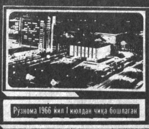
Рўзнома 1966 йил 1 июлдан чиқа бошлаган

№ 203 (7. 892) 1991 йил 21 октябрь, душанба Нархи 8 тийин